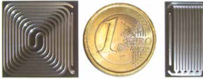
MEMS per preconcentrazione e separazione gas cromatografica

- Sistema Micro-Elettrico-Meccanico dei fluidi (MEMS) applicato al preconcentratore selettivo ed alla colonna di separazione cromatografica (tecnologia proprietaria)